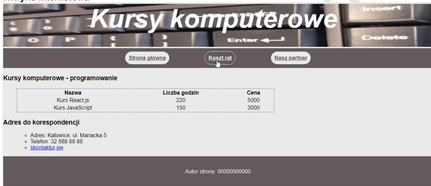
Ilustracja 3. Strona index.html , kursor na odnośniku