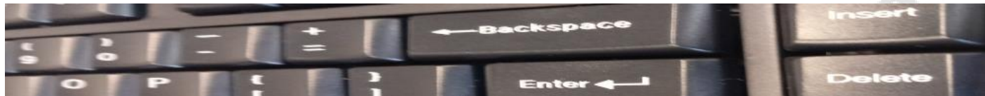
Ilustracja 2. Wykadrowanie obrazu klawiatura.jpg