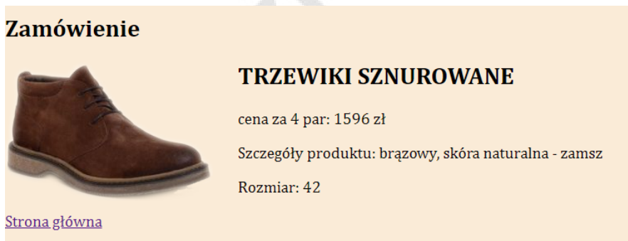
Ilustracja 3. Fragment bloku głównego strony zamow.php