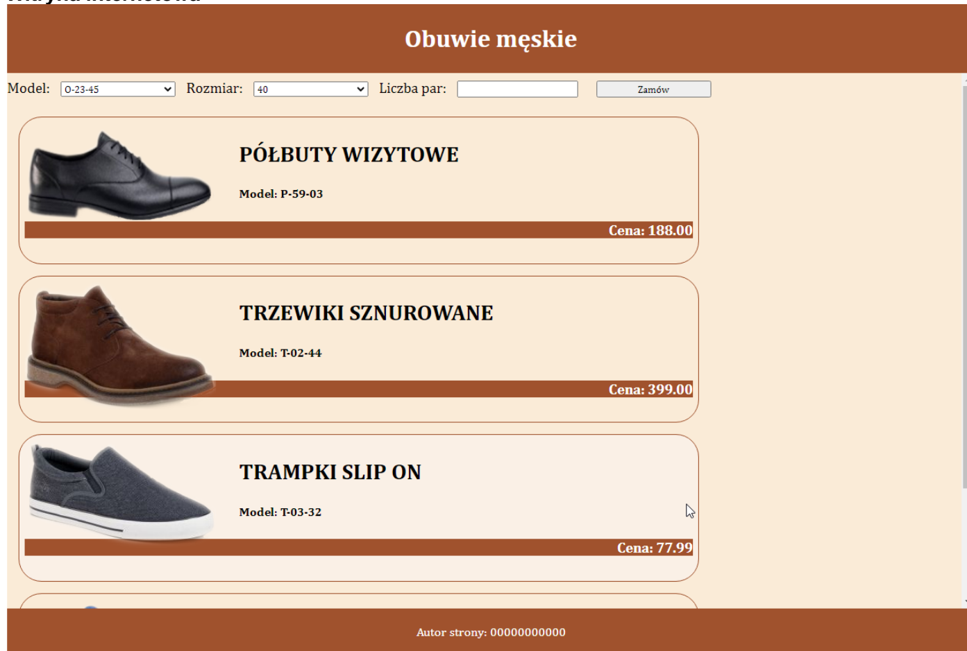
Ilustracja 2. Strona index.php , kursor na trzecim produkcie (zmieniony kolor tła)