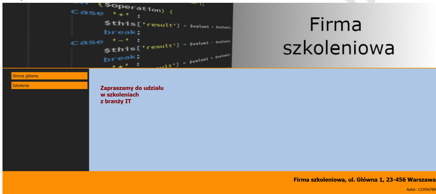
Ilustracja 2. Wygląd strony głównej index.html